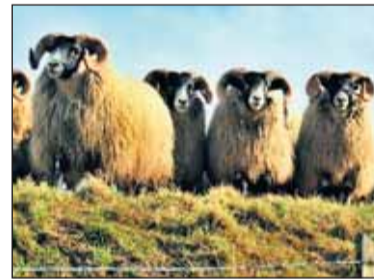
Schapen in Schotland.

De Europese Commissie heeft na een onderzoek van de gelden-