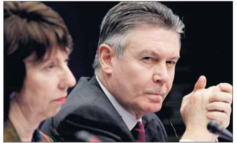
Europees handelscommissaris Karel De Gucht (rechts).

De EU is lang in gesprek geweest met Argentinië en Canada. De Verenigde Staten hebben begin 2008 het verzoek ingediend bij de WTO om strafmaatregelen tegen de EU te kunnen instellen. Aanvankelijk vormden Argenti-