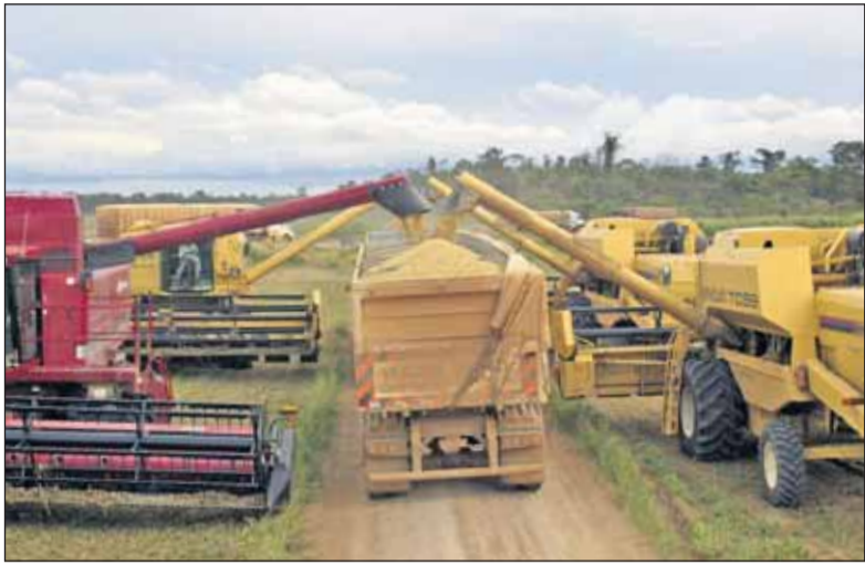
De soja-import moet verminderen, aldus ABC en Milieudefensie.